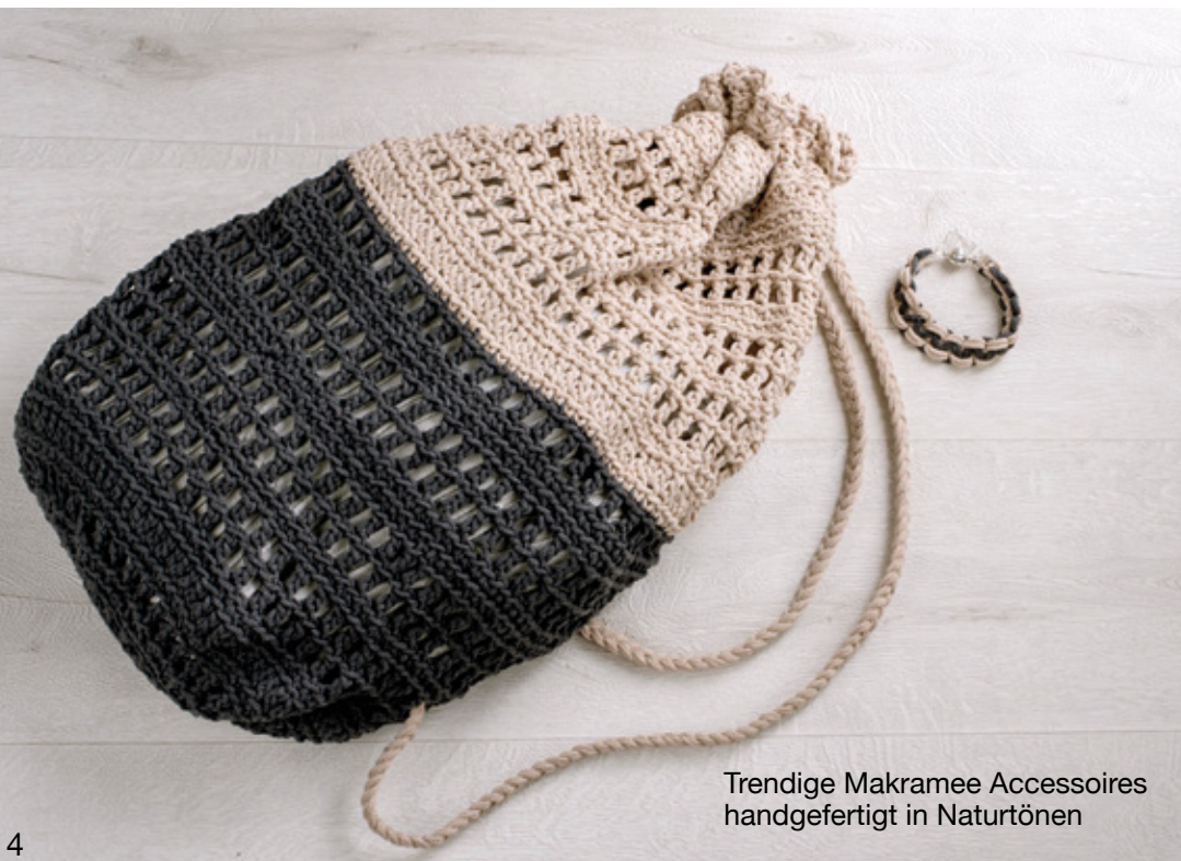
Trendige Makramee Accessoires handgefertigt in Naturtönen